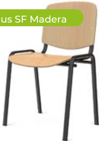
Venus SF Madera