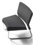
Módulo curva cerrada