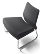
Módulo curva abierta